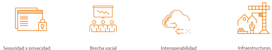
Figura 6. Desafíos las nuevas fuentes de datos y el Internet de las Cosas

A continuación, explicaremos cada uno de los desafíos mostrados en el gráfico: