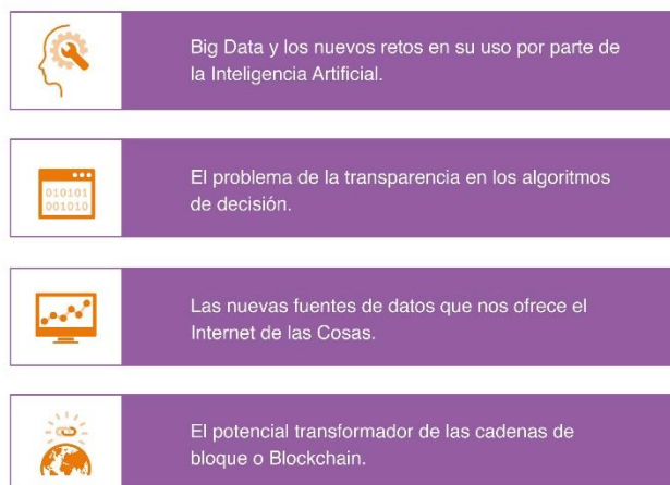
Figura 2. Cuatro tendencias específicas del sector de los datos abiertos.