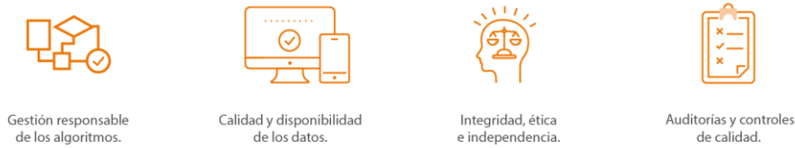
Figura 5. Desafíos de los algoritmos de decisión

A continuación, explicaremos cada uno de los desafíos mostrados en el gráfico: