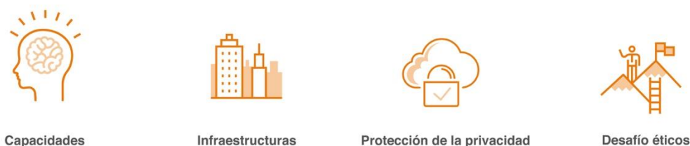
Figura 3. Cuatro desafíos del big data y la inteligencia artificial.

A continuación, explicaremos cada uno de los desafíos mostrados en el gráfico: